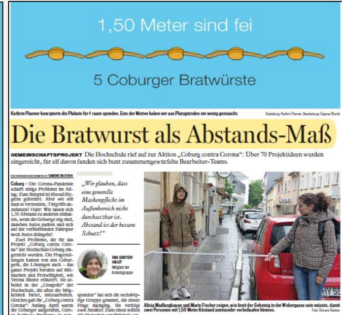
Coburger Tageblatt, 12.05.2020